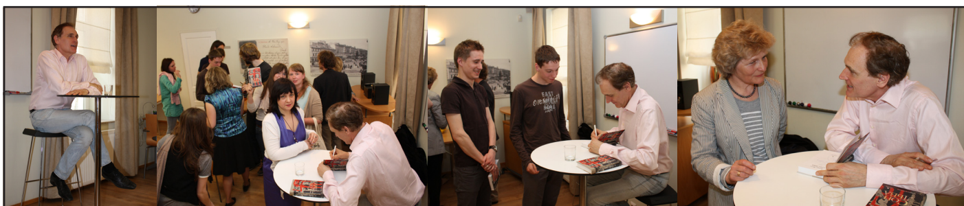
Op 25 april j.l. was Arthur Japin te gast op het NIP ter gelegenheid van het uitkomen van de Russische vertaling van 'De droom van de leeuw'.