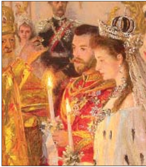
Huwelijk van keizer Nicolaas II en keizerin Alexandra Fjodorovna (L. Tuxen) Венчание императора Николая II и императрицы Александры Федоровны (Л. Туксен)