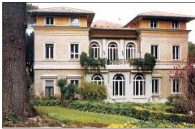
Het Nederlands Instituut in Rome / Голландский институт в Риме.