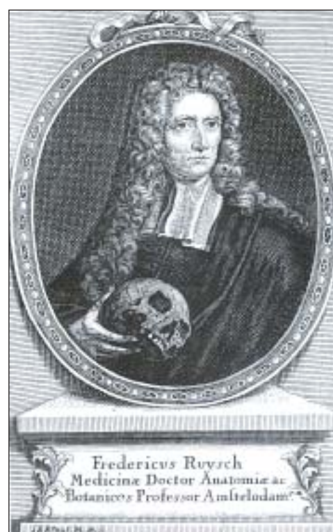
J.E. Kraus. Portret van Frederik Ruysch. Hermitage. Й.Е. Краус. Портрет Фредерика Рюйша. Государственный Эрмитаж.

De expositie duurt tot en met vrijdag 21 januari 2005 en is geopend van 13:00 tot 17:00 uur, van maandag t/m vrijdag.