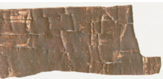
Berkenbastteksten uit Novgorod Берестяная грамота из Новгорода