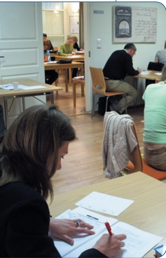
Nieuw leslokaal in gebruik