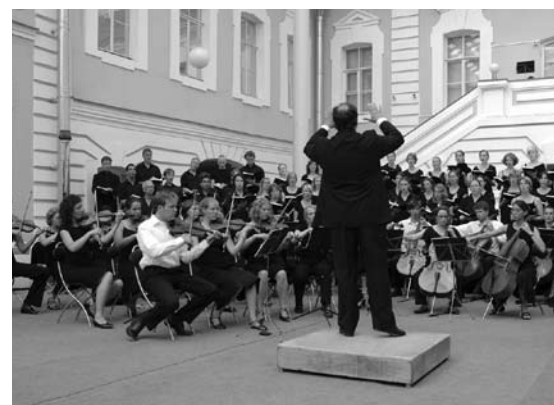
Muziekformatie USKO Музыкальный коллектив USKO

'Ik wil graag nog meer buitenlandse studenten naar Amsterdam halen.'