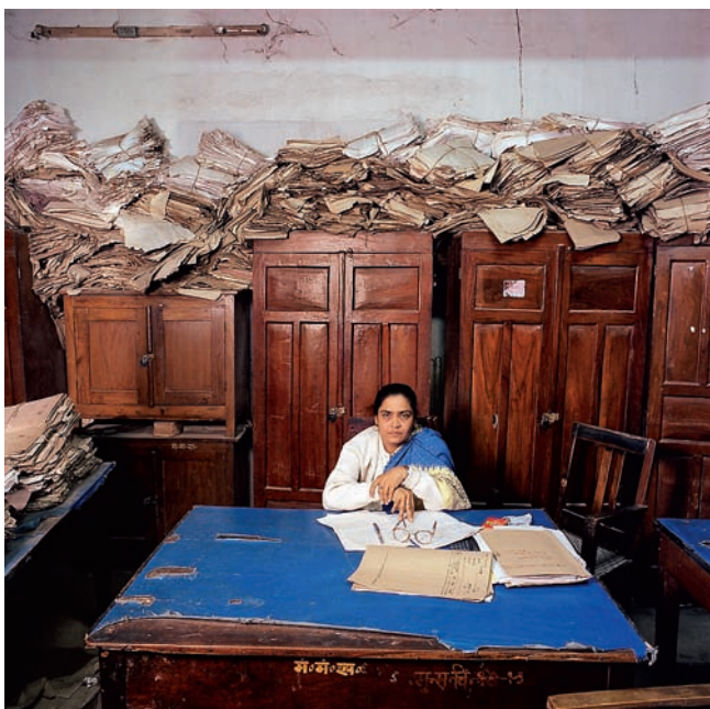
Jan Banning: Bureaucratica – India (links), China (rechts) / Ян Баннинг: Бюрократия – Индия (слева), Китай (справа)

De tentoonstelling was eerder o.a. te zien in New York, Rotterdam, Havana en Berlijn. In Loft Etazji is hij tot 1 juni te bewonderen. Op zaterdag 17 april vanaf 16.00 uur geeft Jan Banning bij de tentoonstelling tekst en uitleg over zijn werkwijze.