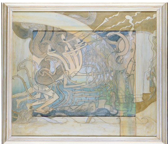
Ян Тоороп. Игра линий. Зарождение, с противодействием, современного искусства (1893)